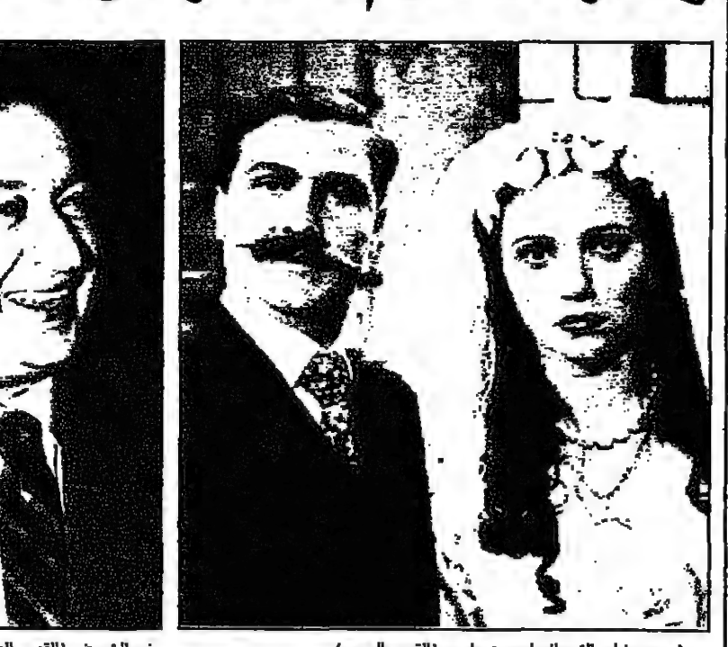
نور الشريف (القديس العربي) مشهد من فيلم «الترحال» لريمون بيلرس (القديس العربي)